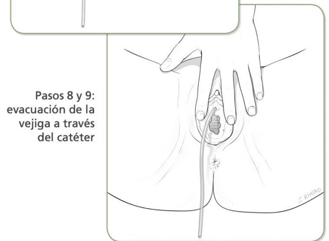
Pasos 8 y 9: evacuación de la vejiga a través del catéter